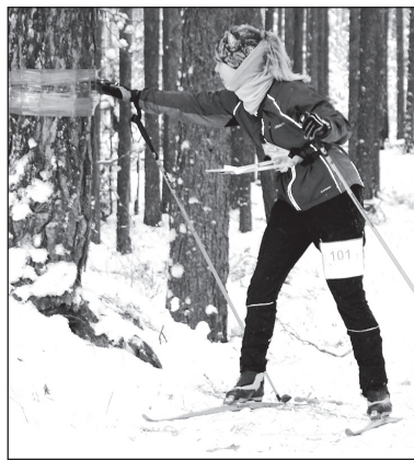
● Контрольная отметка на маршруте.