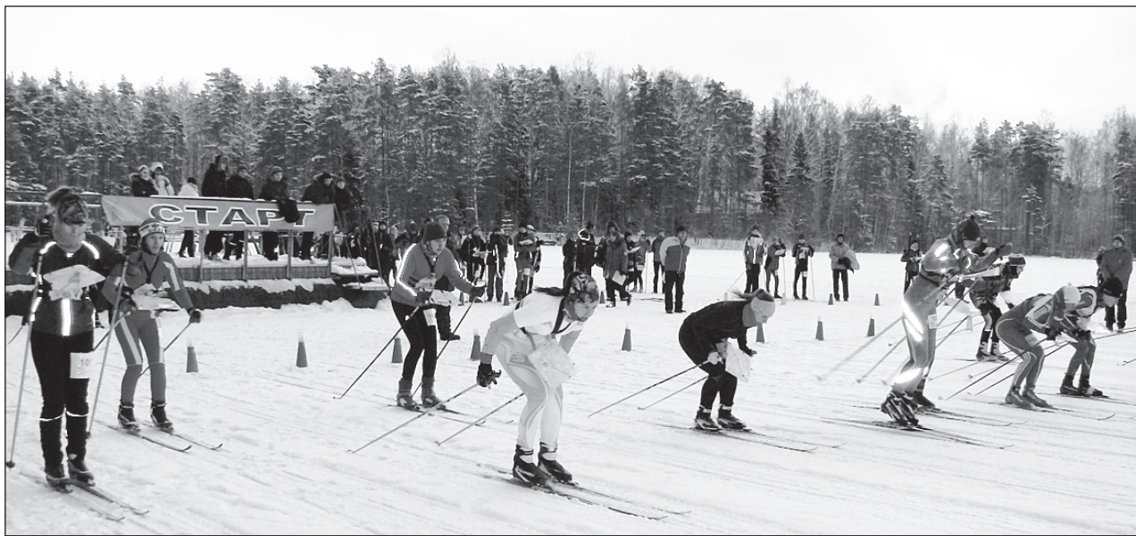
● Стартуют сильнейшие в женском разряде!

В течение трёх дней на базе отдыха «Мечта» ООО «КИНЕФ», как сообщалось в прошлом номере «ЛГК», проходили большие соревнования по лыжному ориентированию, вобравшие в себя чемпионаты и первенства Северо-Западного и Центрального федеральных округов, второй этап III зимней Всероссийской Универсиады, чемпионат и первенство Ленинградской области, а также кубок профкома ООО «КИНЕФ».